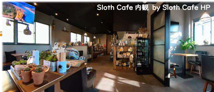
Sloth Cafe 内観 by Sloth Cafe HP

ヨガや栄養、語学や整体等々、多種多様なワークショップの開催、障がい児・病児のきょうだいと家族を支援する会(BRAVE KIDS)、キッズプログラミング教室、SLOTH FIKA(障がい児ママのための茶話会)や障がいに関係する様々なイベントの主催等、多彩な機会を形作っておられます。お店のホームページやSNSにも新しい情報が掲載されております。