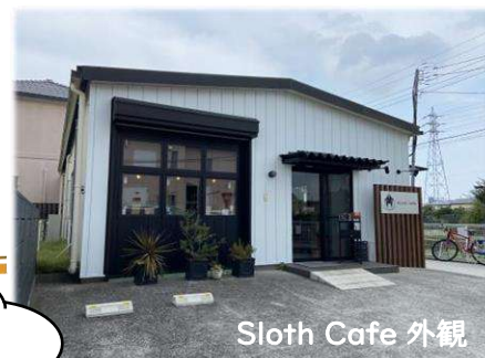
Sloth Cafe 外観

スロースカフェは、「誰もが安心してくつろげる場所をつくりたい」という想いから生まれました。私自身、重度の障がいのある子どもを育てており、外食先で困ることが多くありました。車椅子で入れない、トイレが使えない、食事の形態に対応できない—そんな体験から、「あったらいいな」をかたちにしました。スタッフの多くが、障がい児者の母です。経験があるからこそ、“心のバリアフリー”を大切に、あたたかくお迎えます。ユニバーサルシート付きトイレ、再調理用ミキサーの貸出、小上がりスペースなどもご用意。障がいのある方、ご高齢の方、乳幼児連れの方、どなたでも安心してお過ごしいただけます。また、サークル活動、施設レク、お打ち合わせ、打ち上げなどのご利用も大歓迎です。このカフェが、誰にとっても「居心地の良い場所」になりますように。どうぞごゆっくりお過ごしください。