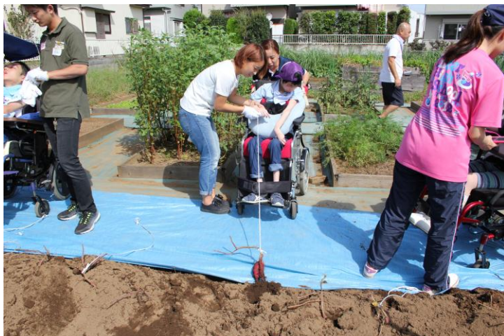
紐を引くことで自分で収穫をした喜びを感じさせる