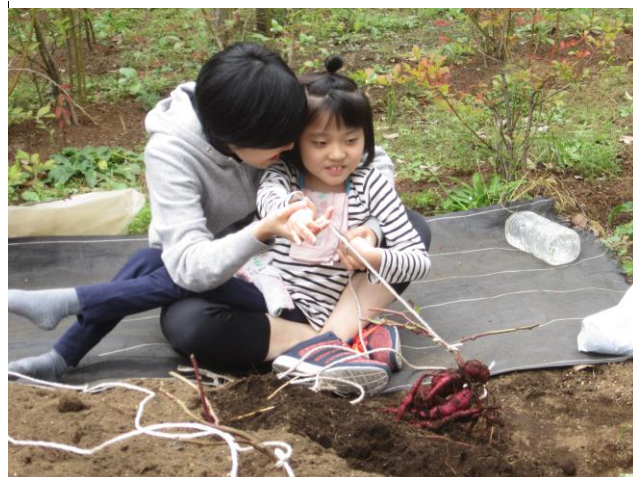
教員とともに収穫したサツマイモを確認する